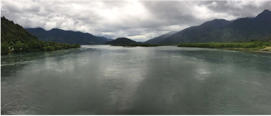
FIGURA 4 | Paisaje río Puelo

Todos los entrevistados y entrevistadas del sector ambiental y turismo mostraron una oposición explícita al proyecto energético. Los(as) empresarios(as) turísticos(as) critican fuertemente el impacto paisajístico de la línea de transmisión eléctrica, pues el paisaje representa un atractivo turístico prioritario en la zona (Turismo D; E; F). Esto resulta congruente con la campaña ambientalista comunicacional en contra del proyecto, en uno de cuyos folletos se lee: “El paisaje se vería fuertemente afectado, reduciendo notablemente los ingresos por turismo de la comuna”. Además, el eslogan de dicha campaña fue “Puelo Sin Torres”. La Figura 4 muestra un ejemplo de la imagen paisajística del río Puelo.