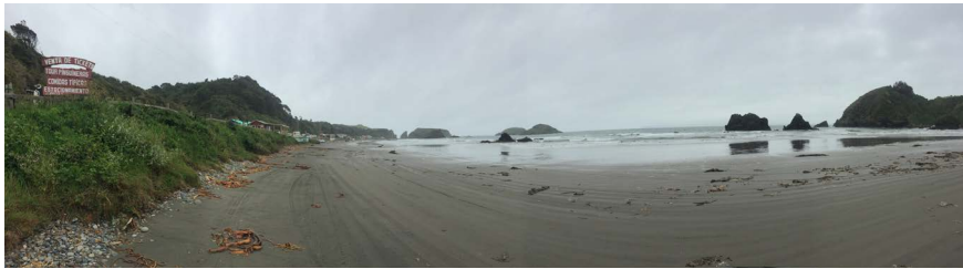
FIGURA 5 | Sector Islotes de Puñihuil

En este sentido, el caso es catalogado como “un conflicto territorial, porque el principal rasgo de este conflicto apunta a vocación o desarrollo alternativo de otros usos o de otras actividades en el espacio donde se emplaza este parque eólico Chiloe” (Ambiente D). Las Figuras 5 y 6 muestran el sector de Puñihuil y Mar Brava, respectivamente.