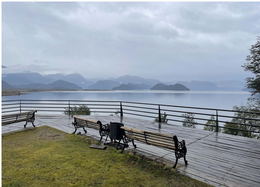
FIGURA 2 | Mirador turístico Bahía Acañilada