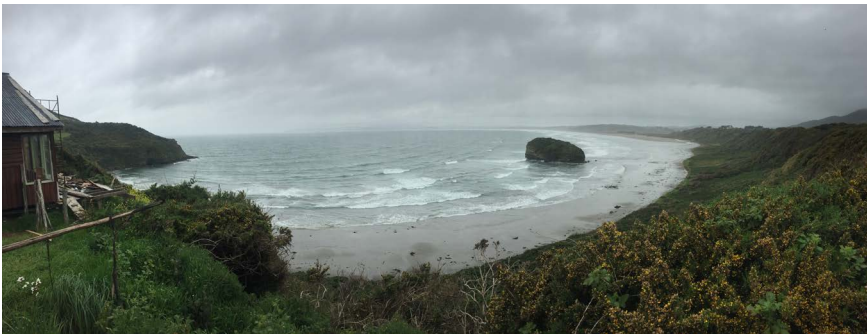
FIGURA 6 | Playa Mar Brava