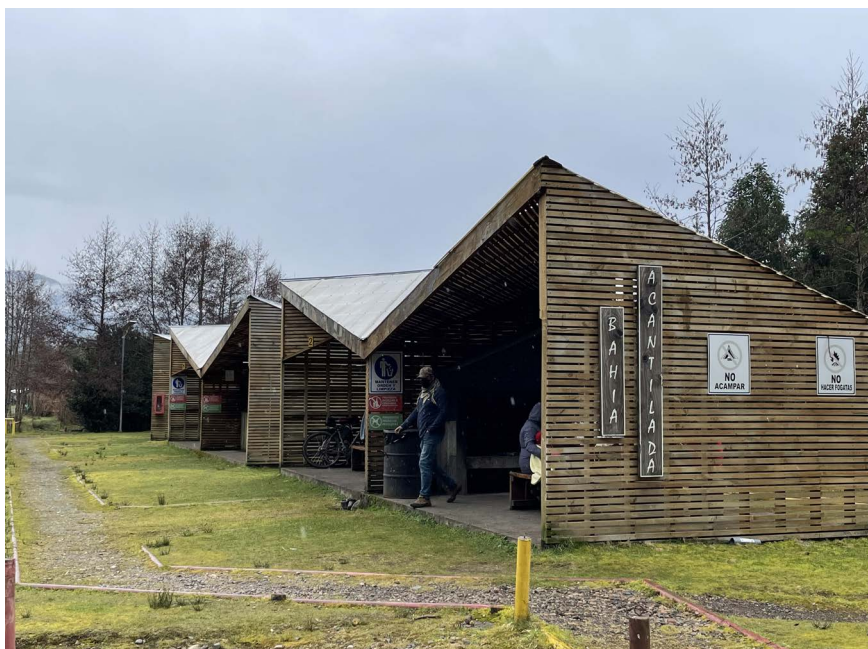
FIGURA 3 | Área picnic Bahía Acañilada