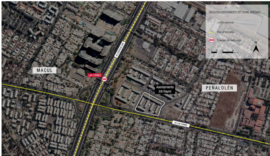
FIGURA 2 | Proyecto Inti Raymi, MPL, Peñalolén