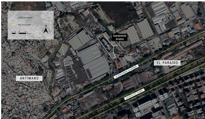
FIGURA 4 | Proyecto Amatina, MPV, Caracas