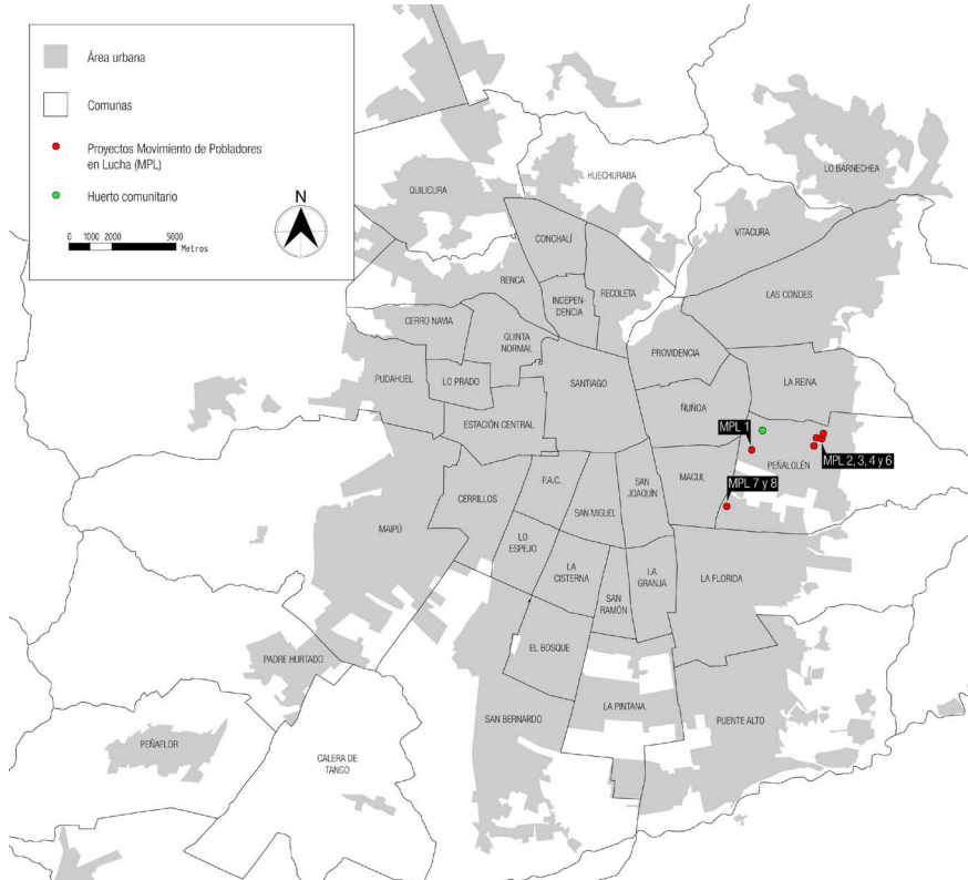
FIGURA 1 | Proyectos habitacionales MPL en Santiago